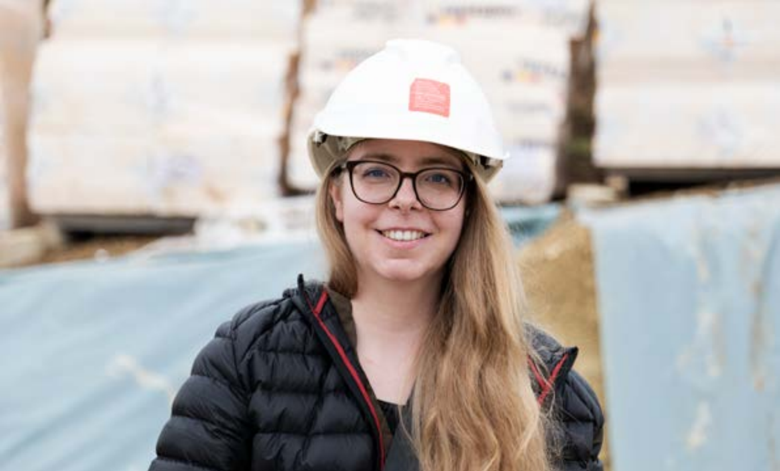
Carolina Stöckli | Stöckli Architektur | Basel | www.stoeckliarchitektur.ch